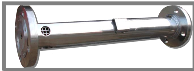
ФОРМА 1 / FORM 1